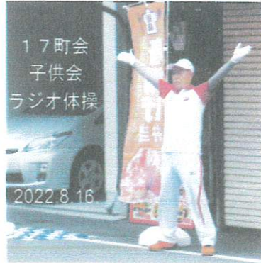
17町会 子供会 ラジオ体操 2022.8.16

ラジオ体操は、 介護・認知症予防に 大変効果があります。 参加は、どなたでも OKとのことですよ。