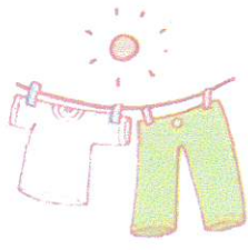
日々感謝 つぶやき人