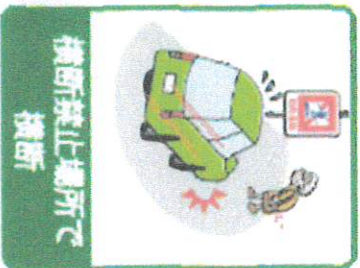
横断禁止場所 横断